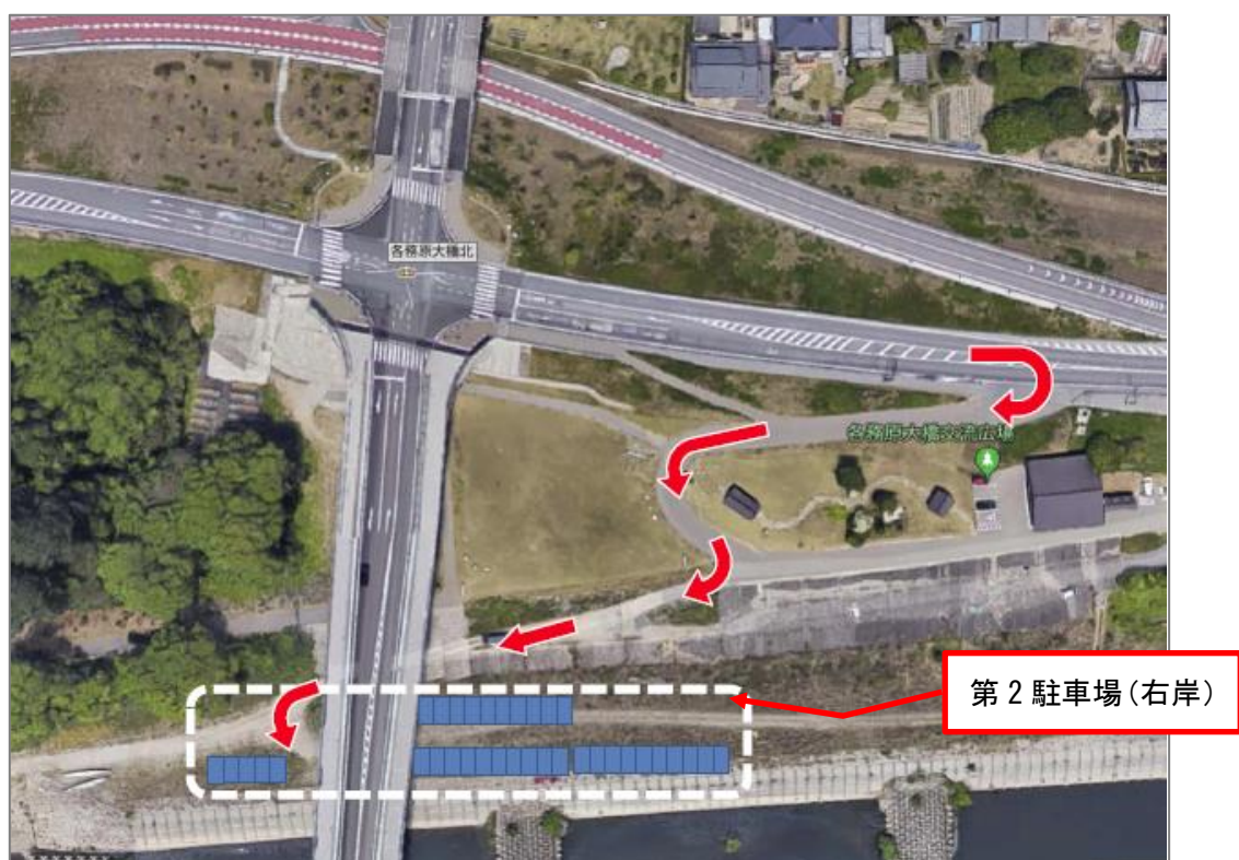
図-4 第2駐車場（30台）右岸