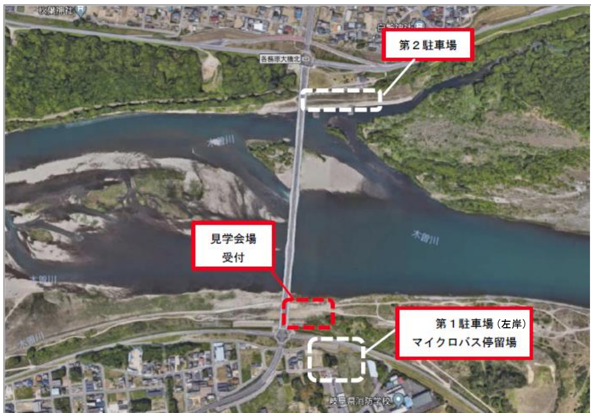
図-2 全体図（今回は木曾川の左岸（南側）河川敷ですのでご注意ください）