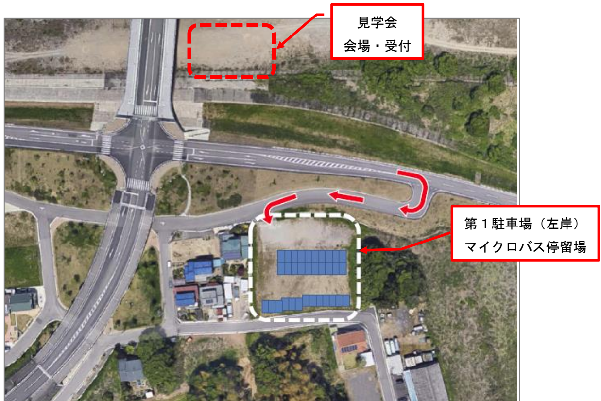
図-3 第1駐車場（50台）左岸，マイクロバス停留場

下記の図-3 第1駐車場（左岸）、図-4 第2駐車場（右岸）に駐車し、徒歩にて見学会場・受付に移動して下さい。なお、 第1駐車場のご利用は各社1台のみ でお願い致します。 各社2台目以降 の駐車は、 第2駐車場 へお願い致します。